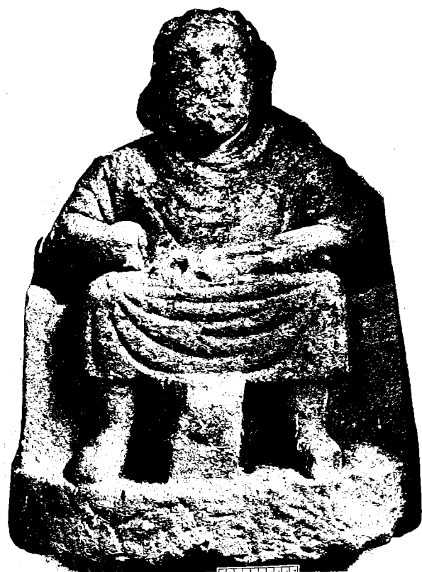
Figura 3. El dios Vulcano, sentado con unas tenazas de herrero y un yunque. (Schwarzerden, cantón de Saint Wendel, Sarre, siglo III d.C.).

Existía asimismo el presentimiento entre los parientes del difunto de que el no llevar a cabo estos símbolos tan del agrado del finado, podrían incurrir en la ira del muerto manifestada en la forma de venganza o persecución contra los suyos.