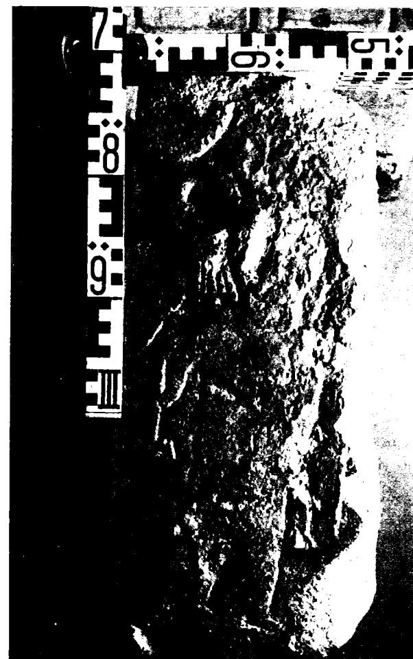
Figura 4. Estela de Ocariz. (Museo Arqueológico de Alava).

representa a una mujer en actitud de manejar la rueca (20). En Ocariz apareció una estela (Fig. 4) con una figura humana que lleva en una mano un martillo y en la otra probablemente una linterna (21). También en Rosillo de Cameros (La Muniña), se encontró hace unos años una estela en la que, entre otros motivos, viene representado un hombre teniendo junto a sí los atributos propios de su oficio: un yunque y un martillo de forja (22). Este tipo de representación pasará al mundo cristiano y siempre con un significado idéntico, es decir, simbolizar el trabajo sencillo y penoso merecedor de recompensa en el más allá (23).