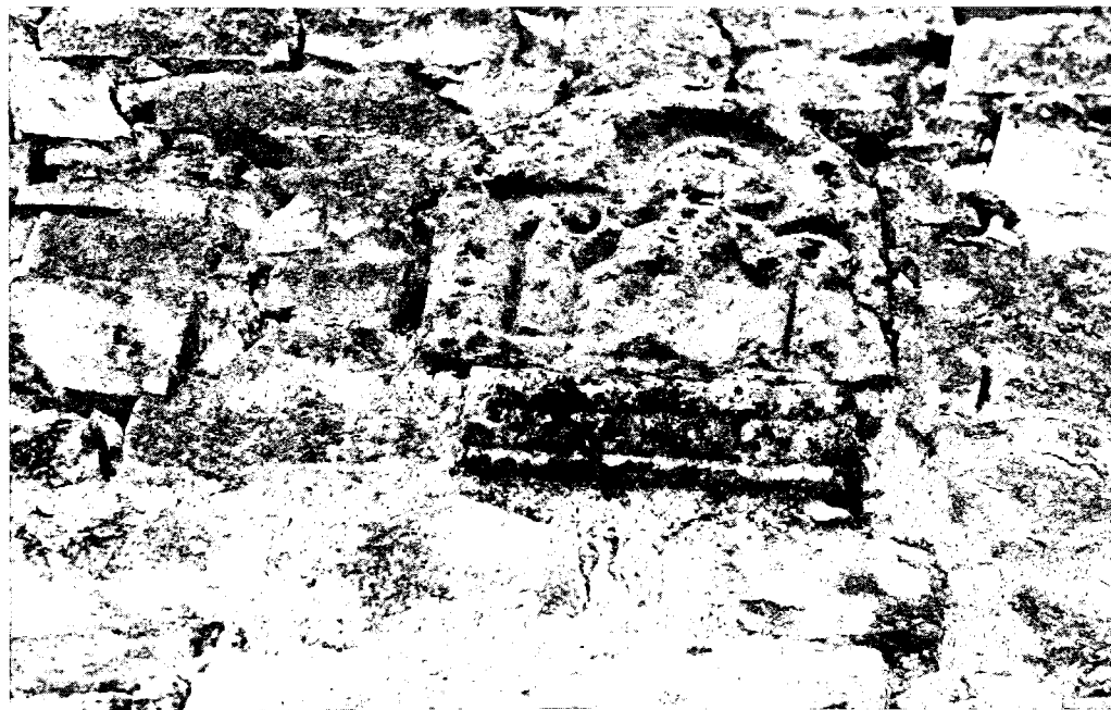
Figura 1. Estela funeraria de Comunción (panorámica general).

Esta pieza de piedra local (arenisca) está empotrada en la parte exterior de la pared norte de una vivienda rústica del pueblo de Comunción y a la altura de unos tres metros del suelo. De ella se puede contemplar la parte alta o sección semiesférica que, tal vez, debió pertenecer a una estela funeraria con representación de una escena humana de no fácil interpretación.